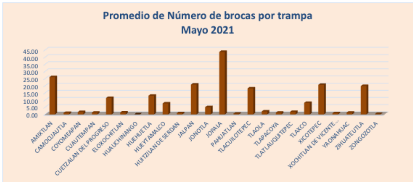
Figura 2. Promedio de número de Broca capturadas por trampa en los Municipios atendidos.