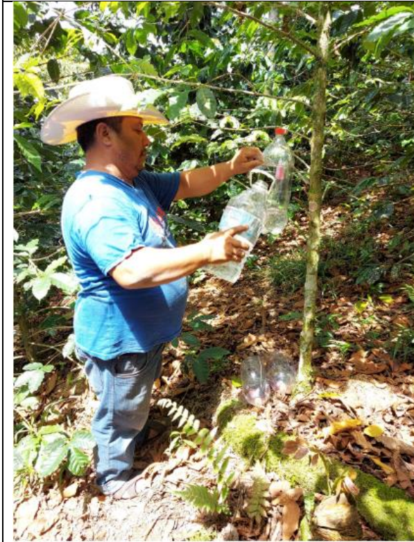
Trampeo de Broca del café.